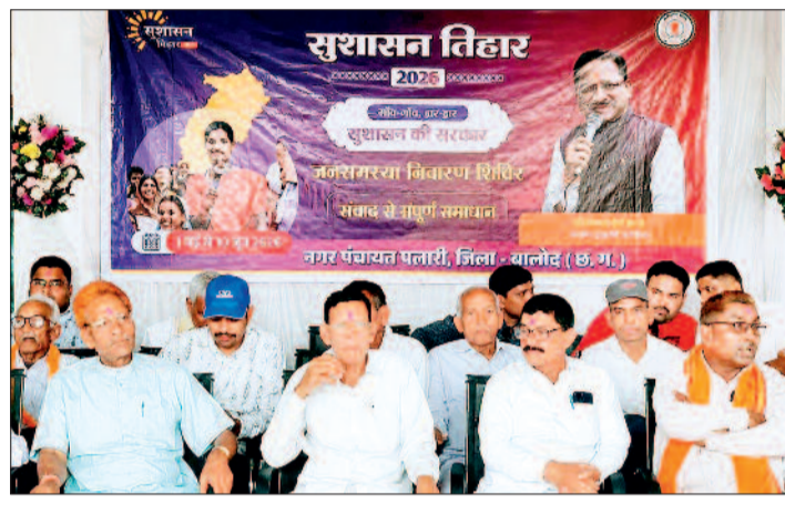
हरिभूमि न्यूज ►► बालोद

सुशासन तिहार 2026 के अंतर्गत गुरूर विकासखण्ड के नगर पंचायत कार्यालय परिसर पलारी में जनसमस्या निवारण शिविर का आयोजन किया गया। शिविर में विभिन्न विभागों से संबंधित कुल 256 आवेदनों में से 73 आवेदनों का निराकरण किया गया। इसके अलावा शिविर में महिला एवं बाल विकास विभाग द्वारा 05 शिशुओं का अन्नप्राशन एवं 03 गर्भवती माताओं का गोद भराई, समाज कल्याण विभाग द्वारा 03 हितग्राहियों को ध्वनि श्रवण यंत्र एवं 05 हितग्राहियों को छड़ी का वितरण और नगर पंचायत पलारी द्वारा 06 हितग्राहियों को राशन कार्ड का वितरण किया गया। इस दौरान मेडिकल बोर्ड में शामिल विशेषज्ञ चिकित्सकों के द्वारा शिविर में दिव्यांगता प्रमाण पत्र बनाने पहुंचे दिव्यांगजनों का दिव्यांगता प्रमाण पत्र भी बनाया गया। शिविर में अतिथियों के द्वारा बच्चों को स्वादिष्ट खीर खिलाकर उनका अन्नप्राशन संस्कार कराया गया। इसके अलावा गर्भवती माताओं को सुपोषण किट भेंटकर उनके गोदभराई के रस्म को पूरा किया गया। नगर पंचायत कार्यालय परिसर पलारी में