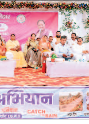
हरिभूमि न्यूज | बालोद

सुशासन तिहार 2026 के अंतर्गत आज गुरू विकासखण्ड के ग्राम अर्जुनी में आयोजित जनसमस्या निवारण शिविर में ग्राम पंचायत अर्जुनी सहित अर्जुनी कलस्टर में शामिल आसपास के 20 ग्राम पंचायतों के ग्रामीण सम्मिलित हुए। ग्राम अर्जुनी में आयोजित शिविर में आज विभिन्न विभागों से संबंधित कुल 721 आवेदन प्राप्त हुए थे जिसमें से 636 आवेदनों को मौके पर निराकरण सुनिश्चित किया गया। शिविर में उपस्थित अतिथियों के द्वारा ग्रामीणों एवं हितग्राहियों को कृषि विभाग अंतर्गत 05 हितग्राहियों को मृदा स्वास्थ्य कार्ड, मत्स्य पालन प्रसार योजना अंतर्गत 02 हितग्राहियों को जाल एवं आईस बॉक्स, सहकारिता विभाग अंतर्गत 03 हितग्राहियों किसान क्रेडिट कार्ड, स्वास्थ्य विभाग अंतर्गत 02-02 हितग्राहियों को आयुष्मान कार्ड एवं निक्षय पोषण किट का वितरण किया गया। इसी तरह समाज कल्याण विभाग अंतर्गत 04-04 हितग्राहियों को श्रवण यंत्र एवं छड़ी, राजस्व विभाग द्वारा स्वामित्व योजना अंतर्गत 11 हितग्राहियों को अधिकार पत्र का वितरण किया गया। इसी तरह 02 हितग्राहियों को मनरेगा जांब कार्ड, 05 हितग्राहियों को प्रधानमंत्री आवास योजना अंतर्गत आवास निर्माण पूर्णता प्रमाण