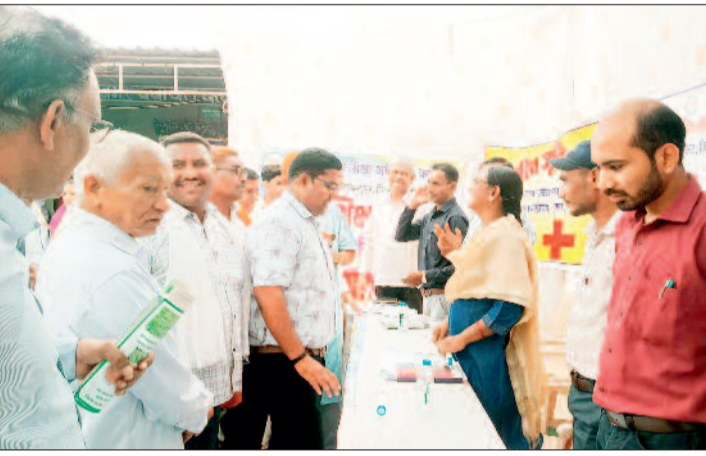
हरिभूमि न्यूज ►► बालोद

सुशासन तिहार 2026 के अंतर्गत गुरूर विकासखण्ड के नगर पंचायत कार्यालय परिसर पलारी में जनसमस्या निवारण शिविर का आयोजन किया गया। शिविर में विभिन्न विभागों से संबंधित कुल 256 आवेदनों में से 73 आवेदनों का निराकरण किया गया। इसके अलावा शिविर में महिला एवं बाल विकास विभाग द्वारा 05 शिशुओं का अन्नप्राशन एवं 03 गर्भवती माताओं का गोद भराई, समाज कल्याण विभाग द्वारा 03 हितग्राहियों को ध्वनि श्रवण यंत्र एवं 05 हितग्राहियों को छड़ी का वितरण और नगर पंचायत पलारी द्वारा 06 हितग्राहियों को राशन कार्ड का वितरण किया गया। इस दौरान मेडिकल बोर्ड में शामिल विशेषज्ञ चिकित्सकों के द्वारा शिविर में दिव्यांगता प्रमाण पत्र बनाने पहुंचे दिव्यांगजनों का दिव्यांगता प्रमाण पत्र भी बनाया गया। शिविर में अतिथियों के द्वारा बच्चों को स्वादिष्ट खीर खिलाकर उनका अन्नप्राशन संस्कार कराया गया। इसके अलावा गर्भवती माताओं को सुपोषण किट भेंटकर उनके गोदभराई के रस्म को पूरा किया गया। नगर पंचायत कार्यालय परिसर पलारी में