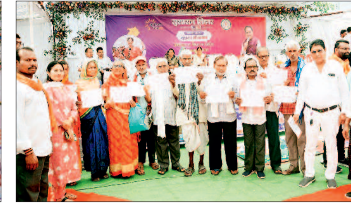
हरिभूमि न्यूज | बालोद

पत्र का वितरण किया। इसके अलावा शिविर में राज्य शासन के निर्देशानुसार दिव्यांगजनों को दिव्यांगता प्रमाण पत्र बनाने हेतु मेडिकल बोर्ड लगाया गया था। इस दौरान मेडिकल बोर्ड में शामिल विशेषज्ञ चिकित्सकों के द्वारा शिविर में दिव्यांगता प्रमाण पत्र बनाने पहुंचे दिव्यांगजनों का दिव्यांगता प्रमाण पत्र भी बनाया गया। शिविर में अतिथियों ने बच्चों का अन्नप्राशन संस्कार कराया गया। गर्भवती माताओं को सुपोषण किट भेंटकर उनसे गोदभरवाई के रस्म को पूरा किया गया। शिविर में आज जनपद पंचायत गुरू के