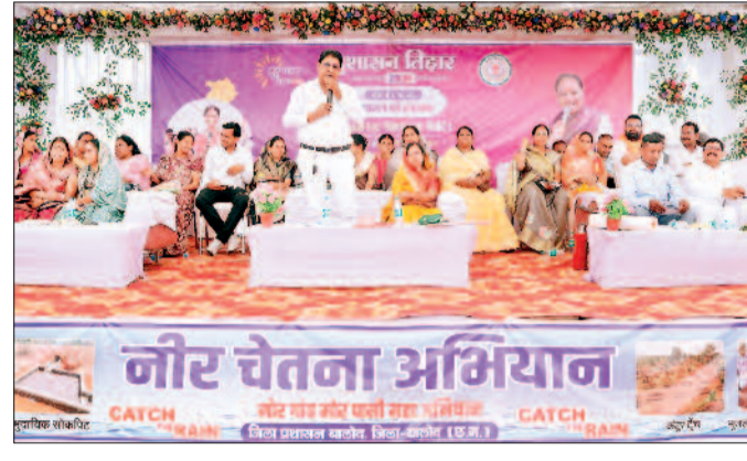
हरिभूमि न्यूज | बालोद

सुशासन तिहार 2026 के अंतर्गत आज गुरू विकासखण्ड के ग्राम अर्जुनी में आयोजित जनसमस्या निवारण शिविर में ग्राम पंचायत अर्जुनी सहित अर्जुनी कलस्टर में शामिल आसपास के 20 ग्राम पंचायतों के ग्रामीण सम्मिलित हुए। ग्राम अर्जुनी में आयोजित शिविर में आज विभिन्न विभागों से संबंधित कुल 721 आवेदन प्राप्त हुए थे जिसमें से 636 आवेदनों को मौके पर निराकरण सुनिश्चित किया गया। शिविर में उपस्थित अतिथियों के द्वारा ग्रामीणों एवं हितग्राहियों को कृषि विभाग अंतर्गत 05 हितग्राहियों को मृदा स्वास्थ्य कार्ड, मत्स्य पालन प्रसार योजना अंतर्गत 02 हितग्राहियों को जाल एवं आईस बॉक्स, सहकारिता विभाग अंतर्गत 03 हितग्राहियों किसान क्रेडिट कार्ड, स्वास्थ्य विभाग अंतर्गत 02-02 हितग्राहियों को आयुष्मान कार्ड एवं निक्षय पोषण किट का वितरण किया गया। इसी तरह समाज कल्याण विभाग अंतर्गत 04-04 हितग्राहियों को श्रवण यंत्र एवं छड़ी, राजस्व विभाग द्वारा स्वामित्व योजना अंतर्गत 11 हितग्राहियों को अधिकार पत्र का वितरण किया गया। इसी तरह 02 हितग्राहियों को मनरेगा जांब कार्ड, 05 हितग्राहियों को प्रधानमंत्री आवास योजना अंतर्गत आवास निर्माण पूर्णता प्रमाण