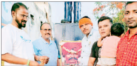
हरिभूमि न्यूज ►► डौण्डीलोहारा